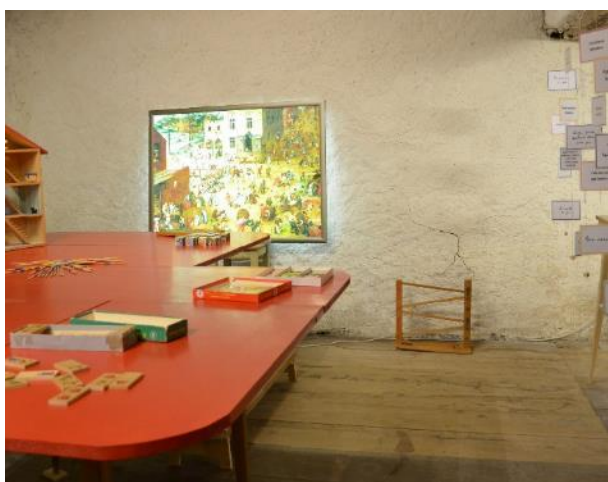
Figure 5 : Espace « À vous de jouer ! »

Cet espace de détente permet à chacune et à chacun de jouer « pour de vrai » avec un choix varié de jeux mis à disposition tels qu'une maison de poupées, un jeu de billes ou encore un pantin en bois.