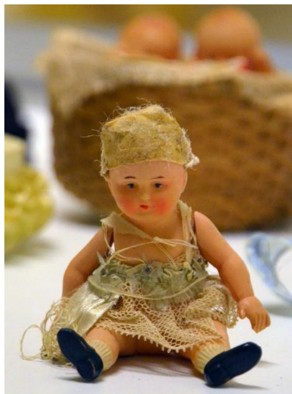
Figure 2 : Petite poupée articulée, Inv. 23.075

de marques emblématiques telles que Petitcollin et Schildkröt dans le paysage des jouets de l'époque.