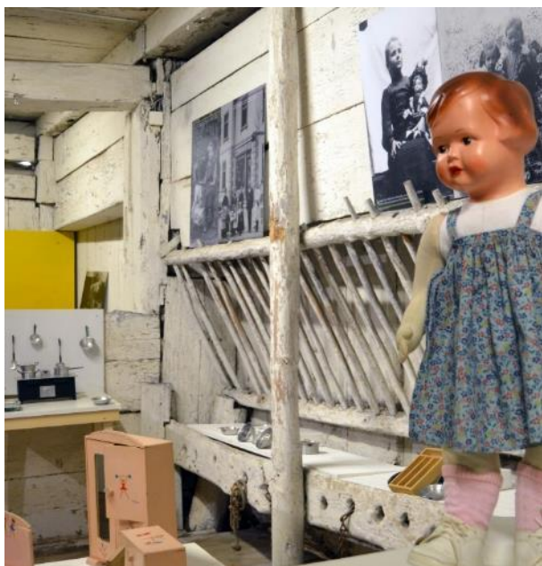
Figure 3 : Poupée, mobilier et batterie de cuisine

L'univers ludique de différentes fillettes est découvert à travers une variété de jouets, allant des meubles de poupées aux ustensiles de cuisine en passant par les poussettes. Certains jouets sont associés à des fabricants renommés tels que Armand Marseille et SIGG Switzerland , tandis que d'autres, comme les mobiliers miniatures, ont peut-être une histoire plus personnelle. Datant des années 1940/1950, ces objets illustrent l'apprentissage des rôles traditionnels de genre et reflètent les valeurs et les rôles sociaux associés à l'enfance et à la vie domestique d'autrefois.