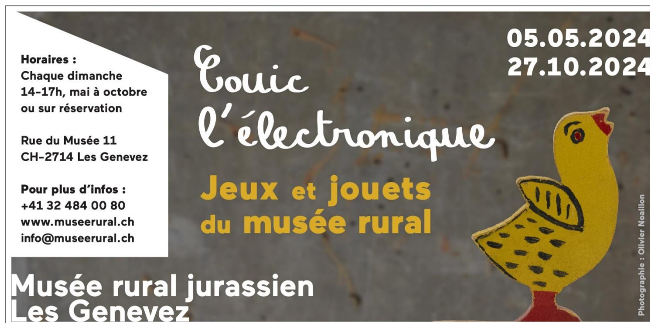
Figure 1 : Exposition temporaire 2024