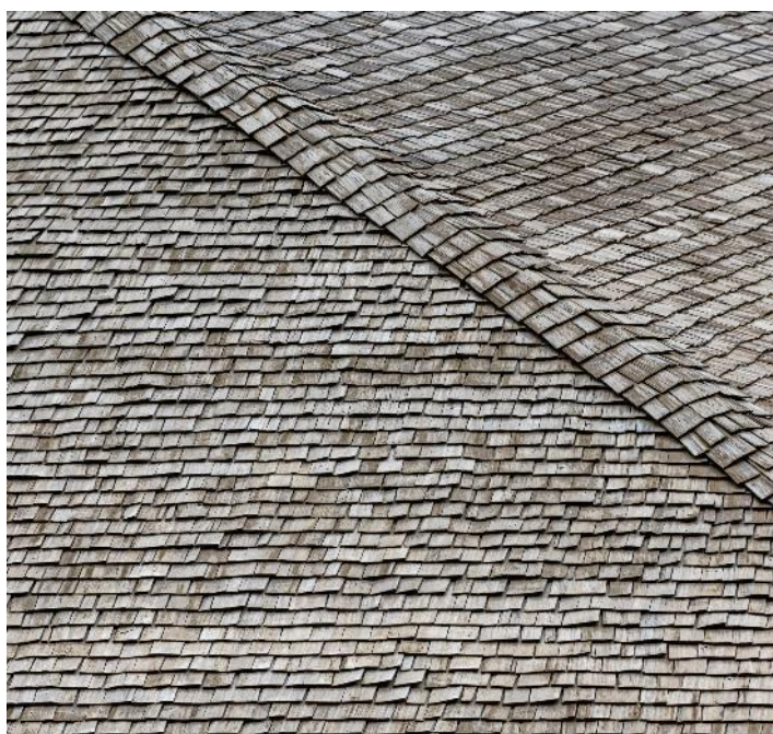
Figure 6 : Toit en bardeaux à quatre pans

Renseignements auprès de Mathilde Brischoux ou à info@museerural.ch